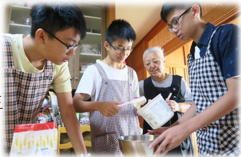
與民家一起製作 當地傳統小食