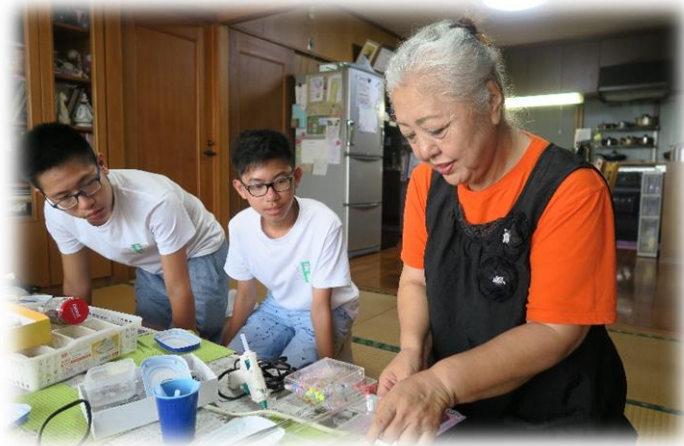
與民家一起製作手工藝