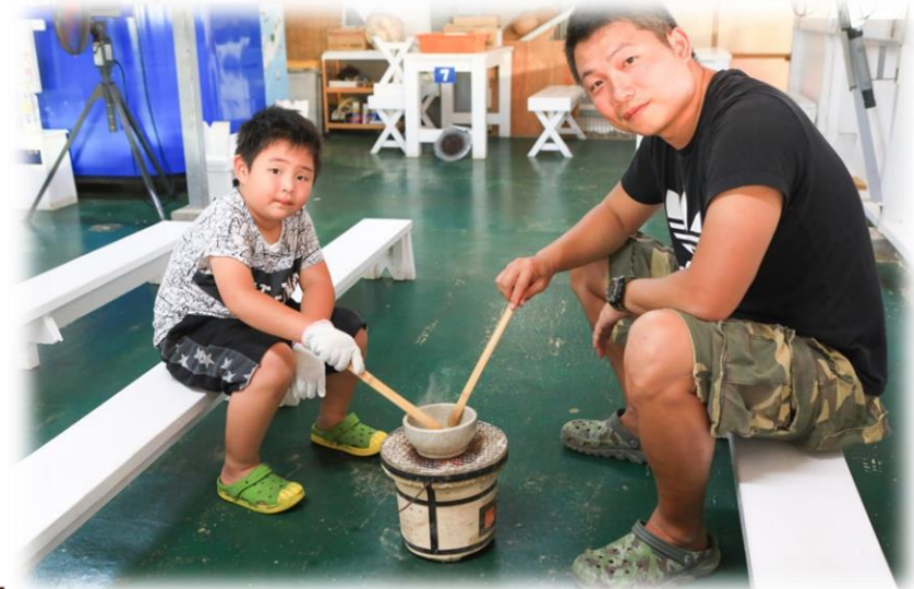
親子體驗海鹽製作