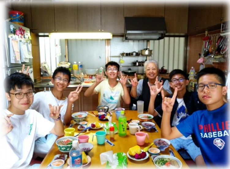
家訪並入住當地民家