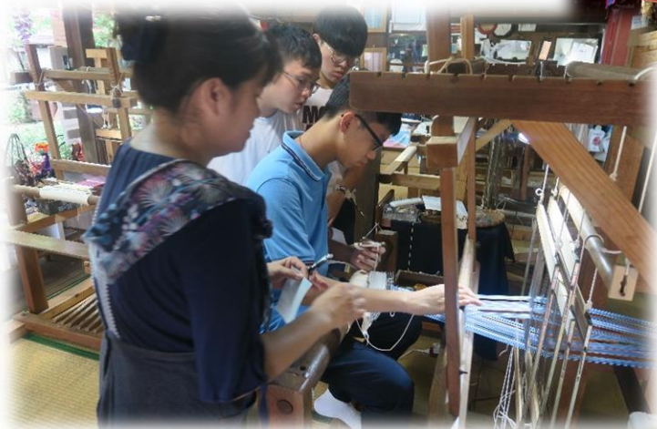
體驗製作傳統工藝